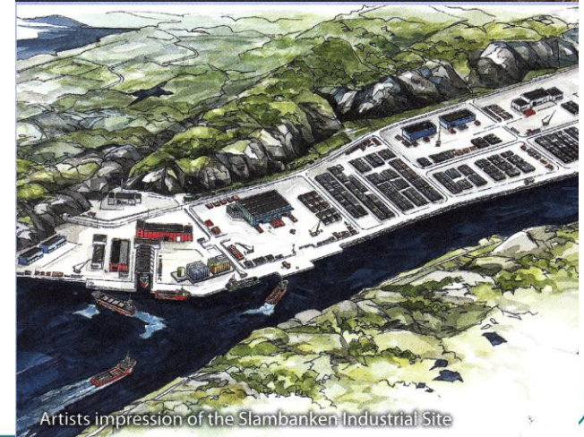
Artists impression of the Slambanken Industrial Site